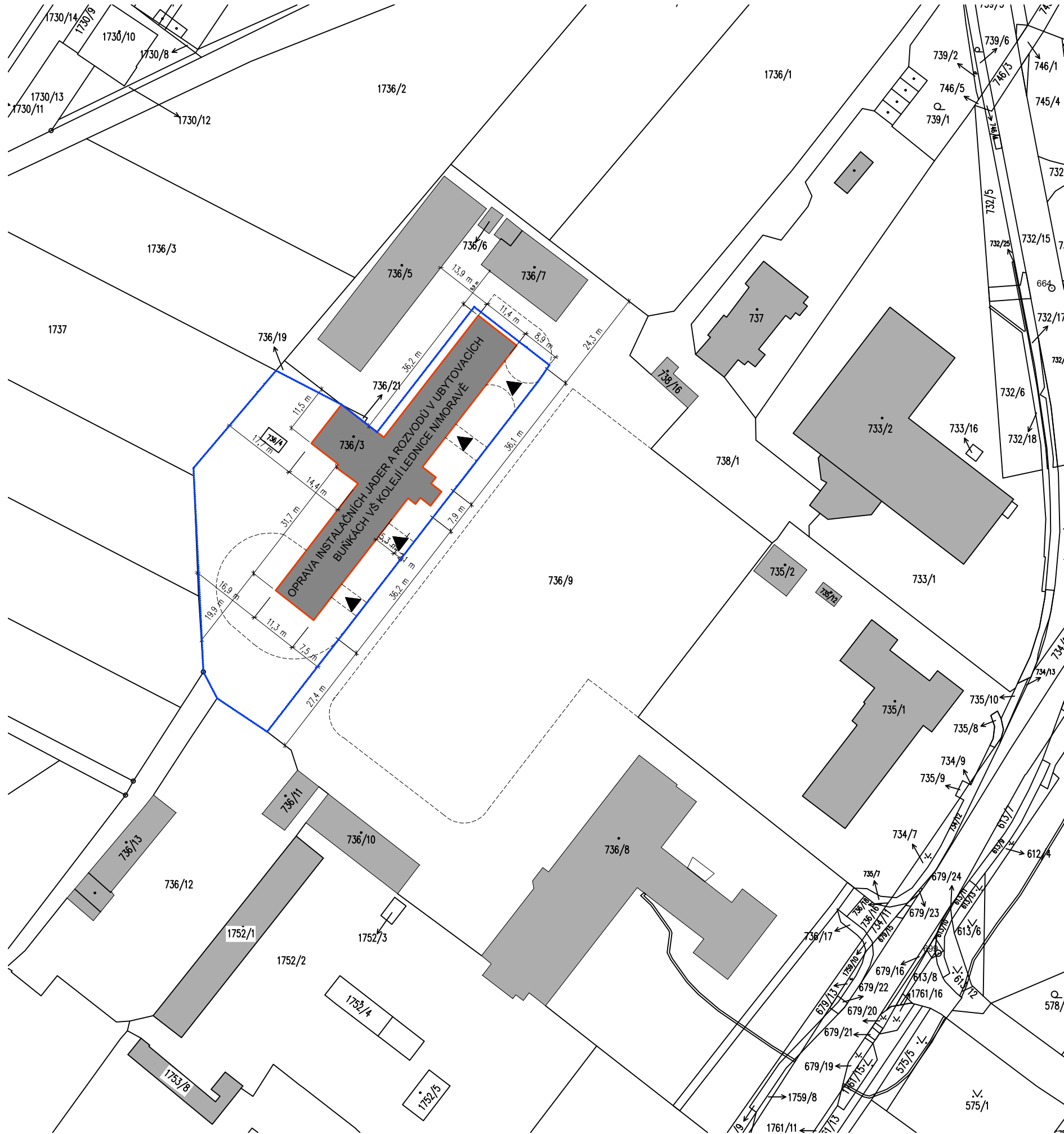
KATASTRÁLNÍ SITUAČNÍ VÝKRES, M1:1000